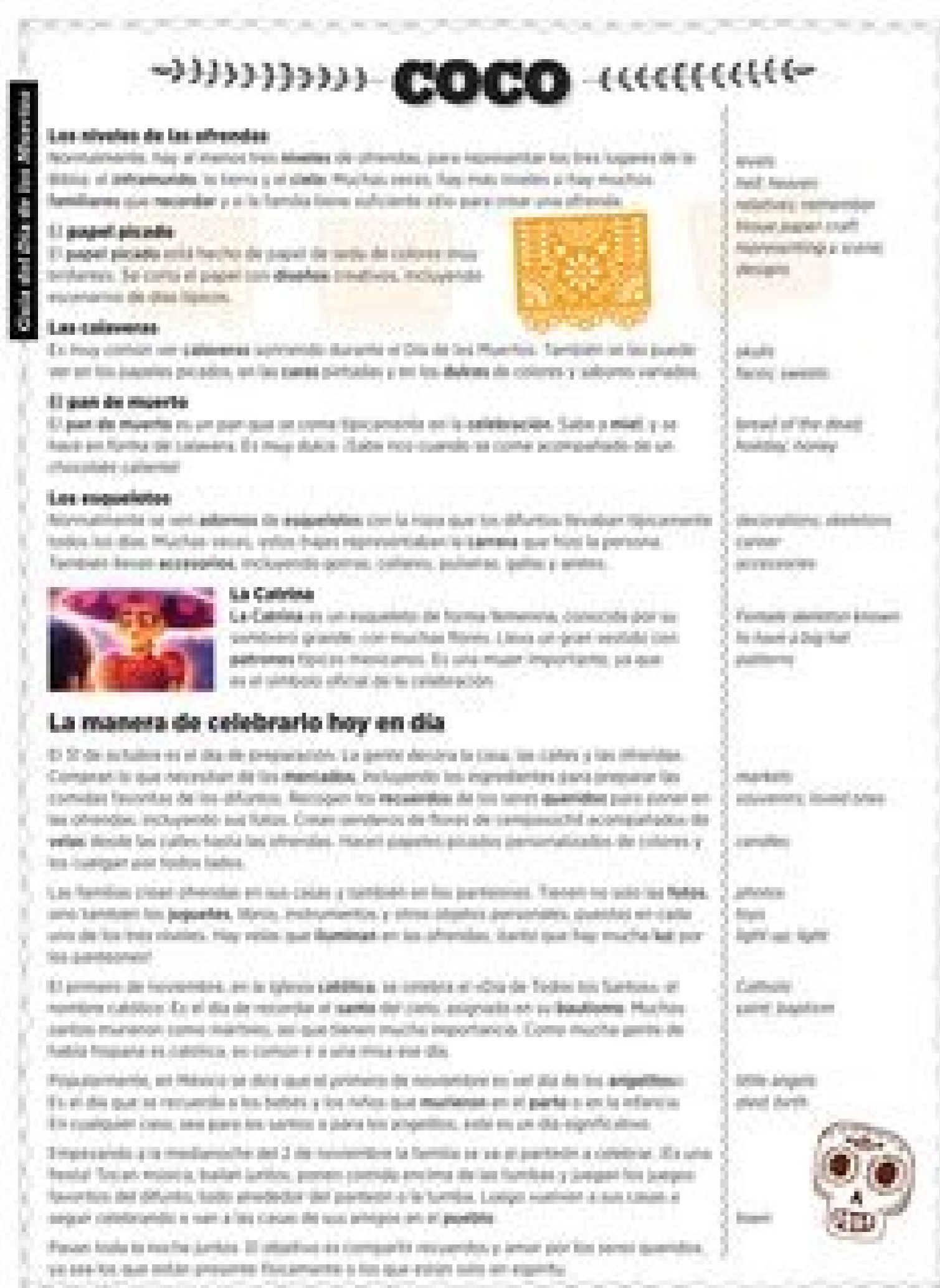
Coco movie review in spanish. Coco movie where in mexico.